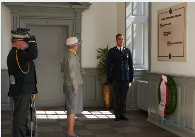
Kranselægning under Hærens Officersskoles 150 års jubilæum 2018