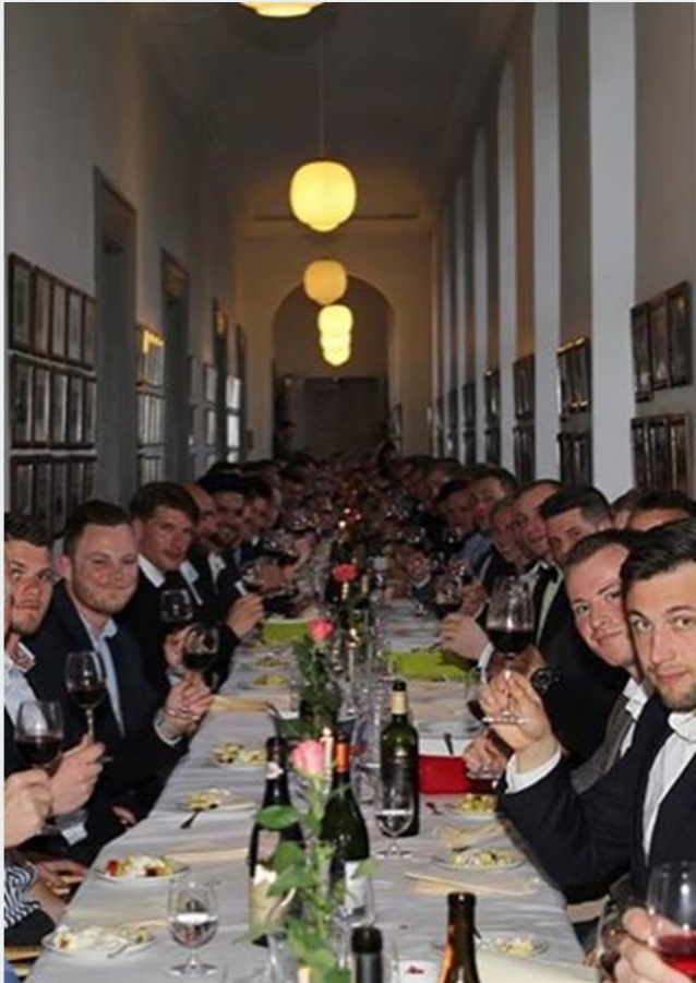
Velkomst for Hold Storrud 2017